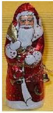
Grafik: Reinhold Vogt